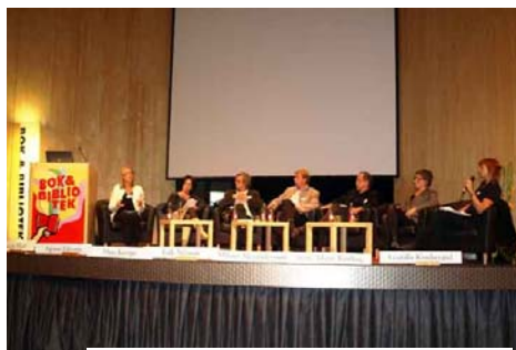
Panelen vid NSG:s seminarium på Bok & Bibliotek