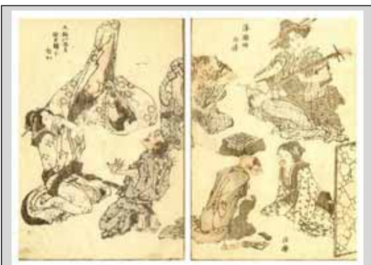
Katsushika Hokusai myntade ordet manga , som betydde ungefär "slarvig/vimsig/hafsig bild".

är inte ute efter att teckna realistiskt. Manga vill symbolisera något snarare än att göra en korrekt avbildning av omvärlden och kryllar därför av bild-metaforer.