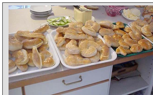
Läckra bokstavsbullar bakades till det gemensamma fiket under förmiddagen.