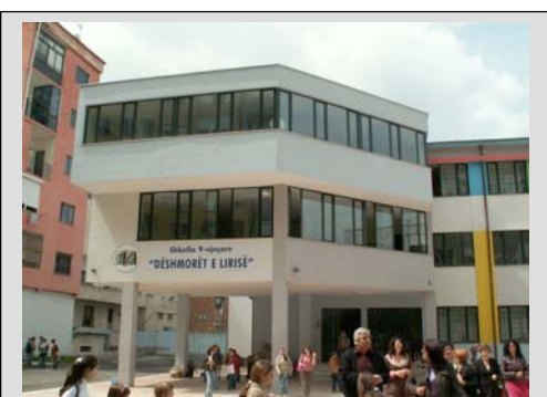
Dëshmoret ë Lirisë – en grundskola i Tirana. i årskurserna 1 till 8 går cirka 600 elever.

Vi har under åren samlat in pengar till skolbiblioteket via bokbord och föreläsningar. 2001 köpte vi bokhyllor, bord, stolar och en mängd böcker. Då avsatte skolan ett klassrum till bibliotek och en lärare med några timmars nedsättning av tjänst för att sköta biblioteket. När vi åkte hem förra gången hade biblioteket ca 300 böcker av någorlunda kvalitet. Det finns fortfarande inget bokanslag för att köpa in böcker.