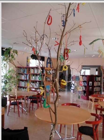
Ett stort bokstavsträd skapades i biblioteket.

En sedan länge närd dröm att anordna en bokdag eller en manifestation för det skrivna och för det magiska i böckernas värld har kommit att infrias! Idén om denna bokdag tog fart under vårterminen 2005 och i samarbete med våra pedagoger skapade vi en idébank med aktiviteter runt boken under en heldag. Ett bokträd med bokstäver att hängas i biblioteket skapades, en mängd bokstavsbullar bakades till det gemensamma fiket under förmiddagen, en