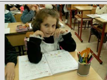
De flesta barn börjar skolan när de är 6 år och går 8 år i skolan. Var tredje elev fortsätter till gymnasiet.

gärna låna hem böcker. En gång om året görs en statlig revision, alla böcker kontrollräknas och saknas någon bok dras kostnaden på skolbibliotekariens lön. Jag förstår att biblioteket är hermetiskt tillslutet under veckorna. Dessutom undrade jag om nya böcker köps in för att ersätta de saknade, men då tittade man bara undrande på mig. Skolbiblioteket är ett rent lånebibliotek, inga "bokprat" eller andra läsfrämjande aktiviteter