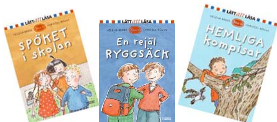
Tre fristående böcker i en lättläst serie om Klass 1b.